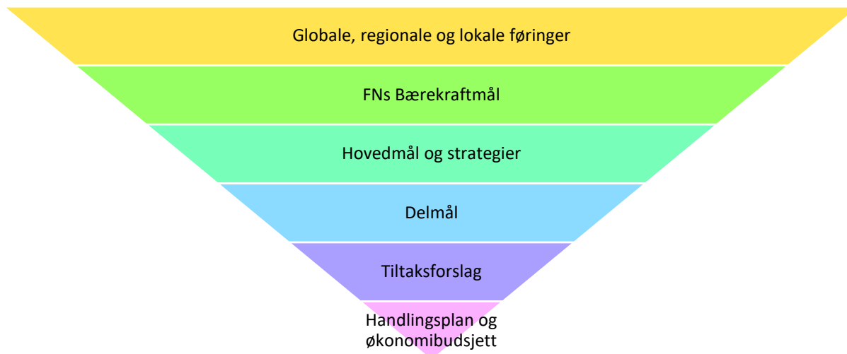
Figur 1 Beslutningstrakt for målhierarkiet i kommunal planlegging

Målhierarkiet i kommunal planlegging kan visualiseres som en beslutningstrakt (se figur 1). Planleggingen må ta utgangspunkt i globale, regionale og lokale føringer for samfunnsutviklingen, som naturlig knyttes til utfordringene som søkes løst gjennom FNs Bærekraftsmål. Samfunnsplanen oppsummerer dette, samt kommunens hovedmål for samfunnsutviklingen og strategiene for hvordan målene skal nås.